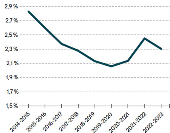
Dépenses en santé publique par rapport à l’ensemble des dépenses de programmes, Québec, 2014-2023

Plus récemment, au Québec, l’austérité budgétaire imposée par le gouvernement Couillard a entraîné une diminution en valeur absolue du financement de la santé publique. Ce dernier est passé de 458 millions de dollars à 418 millions entre 2014 et 2019.